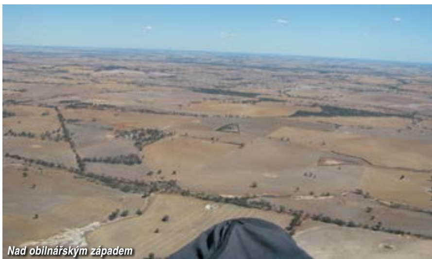
Nad obilnářským západem

toto nepodařilo, po pár desítkách kilometrů jsem vždy „utekl“ na zem před převývoji. Byť na malé vzdálenosti, tyto přelety patří k tomu největšímu, co jsem v životě zažil.