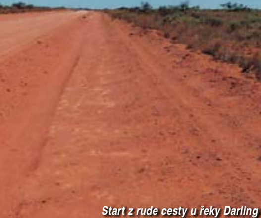
Start z rude cesty u řeky Darling