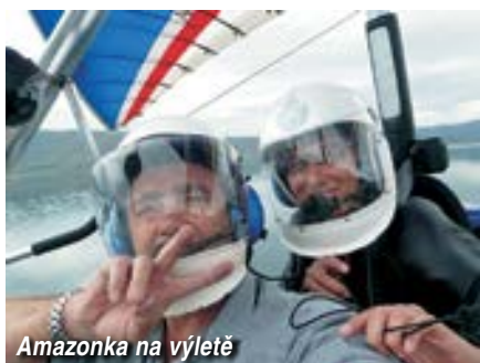
Amazonka na výletě