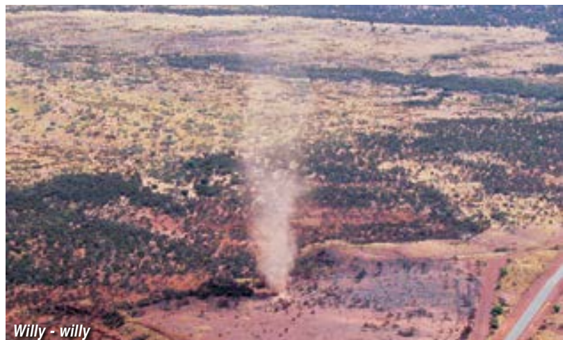
Willy - willy