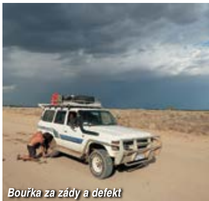
Bouřka za zády a defekt

aby Egyptance zbyly síly. Kožené rukavice jsou nutné, jinak hrozí puchýře od popálenin. Padáky pokládáme na rozpálený písek s nejvyššími obavami, bod tavení padákových šňůr je 135 stupňů a Skytex na tom není lépe. Navléci se, pomalými pohyby se nachystat ke startu a hurá nahoru. Z vyhlídky na jezera kolem řeky mám optimistické pocity, na obzoru se objevují