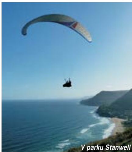
V parku Stanwell