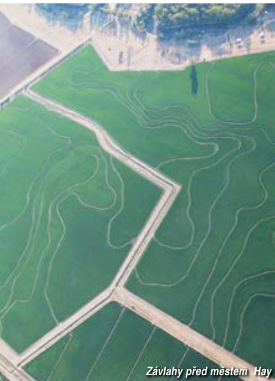
Závlahy před městem Hay