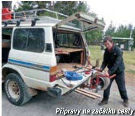
Přípravy na začátku cesty