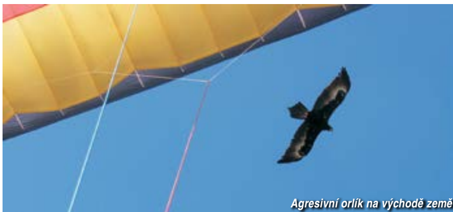
Agresivní orlík na východě země