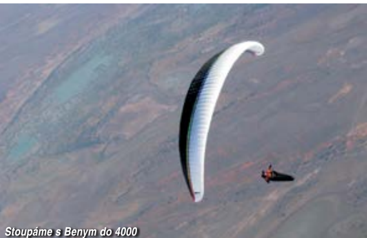
Stoupáme s Benym do 4000

Beny mne povzbuzuje teď už ze země k přeletu cca 35km pustinu po větru, na severu je podle mapy asfaltová cesta. Mě je ale jasné, že tohle by mohlo být moje poslední rozhodnutí v životě, a tak bojuju proti větru v malých bublinách sem a tam. Jedna bublina mi pomohla aspoň s pár set metry výšky a tak doklouzávám proti větru na přistání jen asi 4 km od Benyho. Uff, to už hravě dojdu, říkám si. A cestou se ještě vykoupu v nejčistším jezeře v okolí. Na přistání je pěkné stádečko klokanů, rozeskáče se na všechny strany. Sundávám helmu a namísto ovanutí větříkem mám pocit jako bych otevřel dvířka do rozpálené pece. Jako když přiložíte několik polínek a žhavý plyn z kamen vám dýchne do obličeje. Nechávám si jen tenounkou