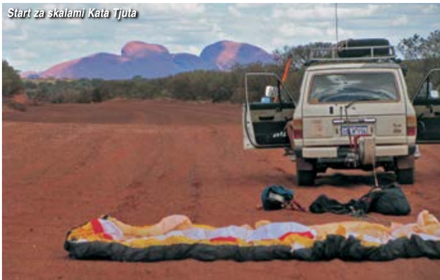
Start za skalami Kata Tjuta

Podmínky ve vzduchu jsem zaznamenal „obrovské“. Dostupy nad 4000 metrů. Zemský povrch je přitom jen pár set metrů nad mořem. Ploché kumuly až desítky kilometrů rozsáhlé. Šířky stoupáků mnoho a mnoho kilometrů. Při troše štěstí na pomalejší vývoj a pořádné dávce odvahy se tu dají letět mnohasetkilometrové přelety. Mě se