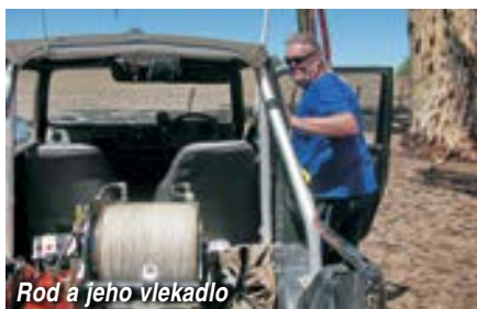
Rod a jeho vlekadlo