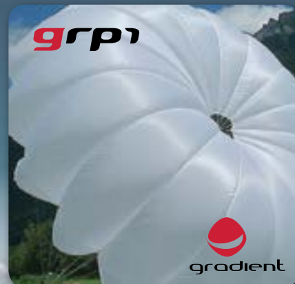
založní padáky Gradient