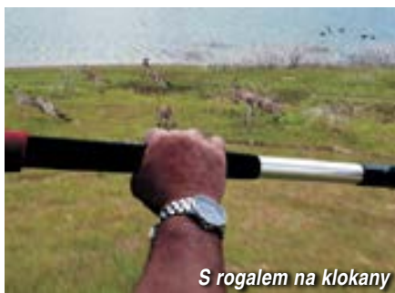
S rogalem na klokany