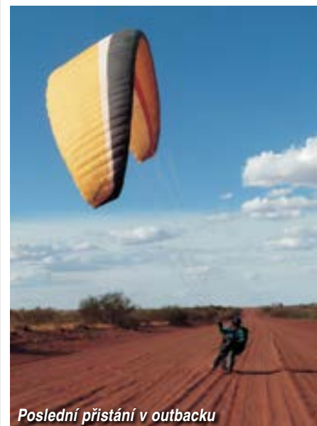
Poslední přistání v outbacku

lem není téměř žádné, mimo města na okrajích kontinentu. Třeba ve srovnání s Jižní Afrikou, kde jsou obdobně řídké osídlená území, je tu pokrytí tak stokrát horší.