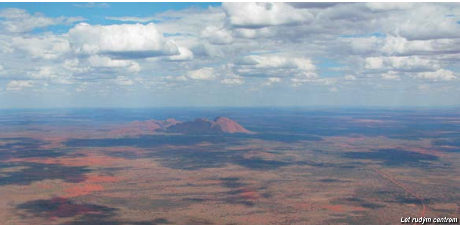
Let rudým centrem