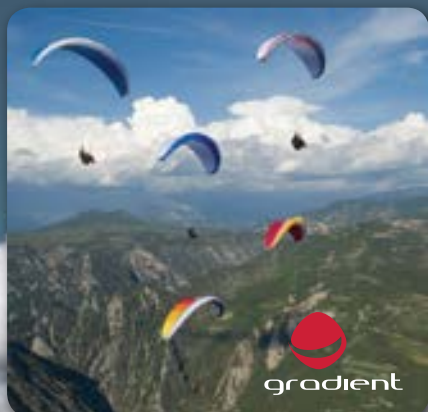
bazarové kluzáky Gradient