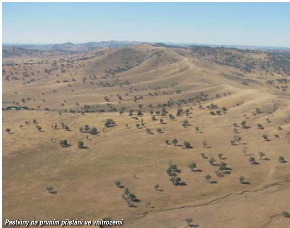
Pastviny na prvním přistání ve vnitrozemí

s vysílačkou vás po špatném přistání nenajde dál jak pár kilometrů od cesty. Přesně proti téhle zásadě jsou nasázeny prostory CAR166. Australan Rod, komisař pro XContest, nám v e-mailech vysvětluje, jak se jejich sportovní letecká konfederace marně snažila vyjmout sportovní letectví z této