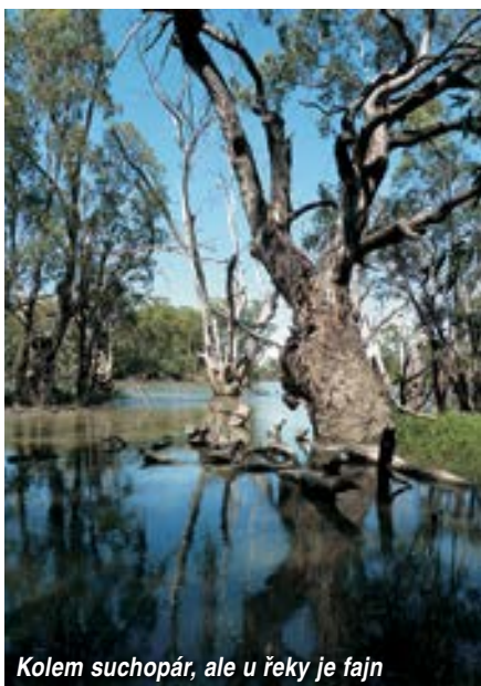
Kolem suchopár, ale u řeky je fajn

s vysílačkou vás po špatném přistání nenajde dál jak pár kilometrů od cesty. Přesně proti téhle zásadě jsou nasázeny prostory CAR166. Australan Rod, komisař pro XContest, nám v e-mailech vysvětluje, jak se jejich sportovní letecká konfederace marně snažila vyjmout sportovní letectví z této