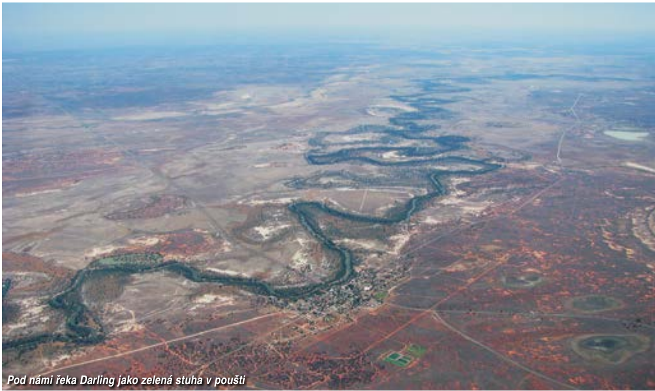
Pod námi řeka Darling jako zelená stuha v poušti